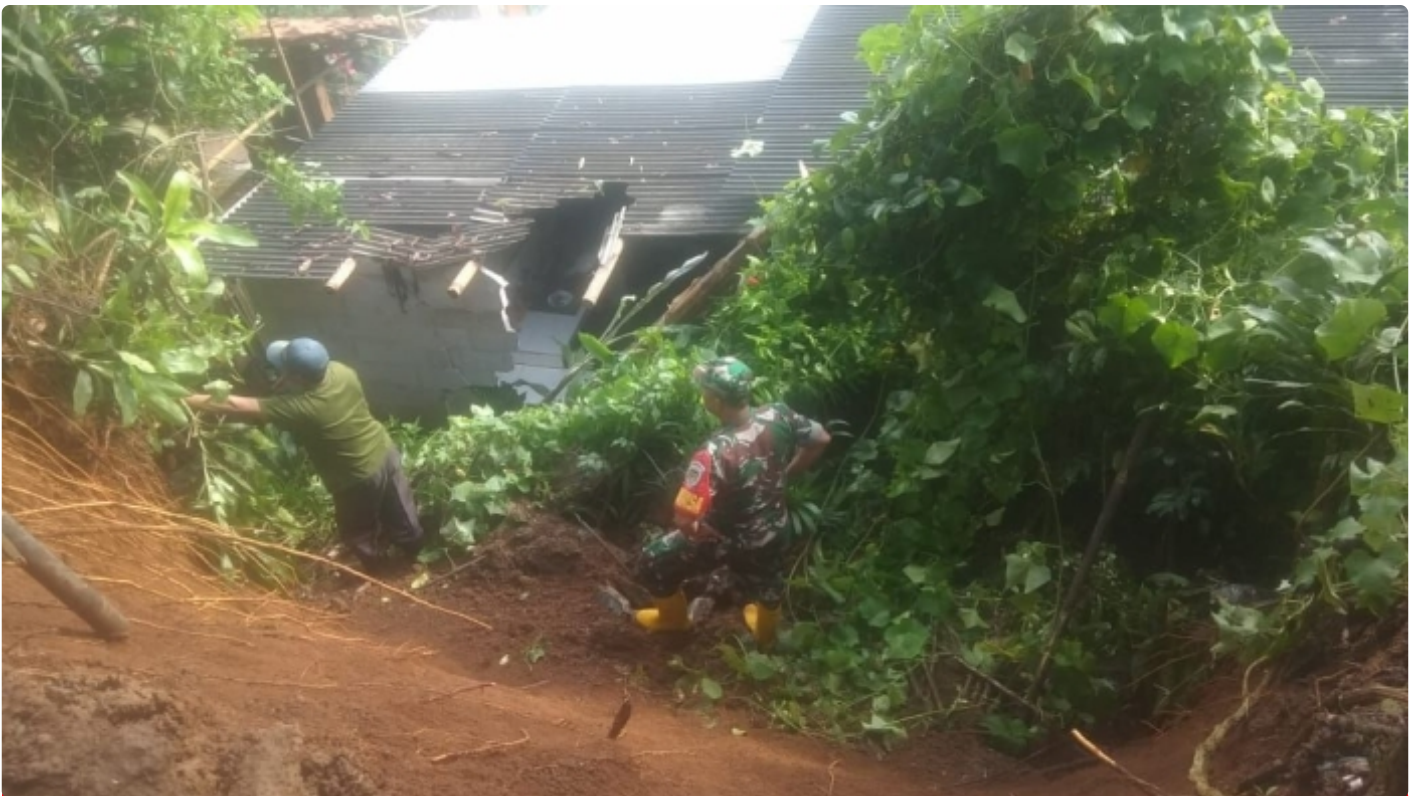
Babinsa Koramil 0622-04/Cikidang Cek Longsor di Wilayah Desa Pangkalan Kecamatan Cikidang Kabupaten Sukabumi

Sukabumi - Babinsa Desa Pangkalan bersama Pemerintah Desa, Babinkamtibmas, dibantu warga setempat telah mengecek lokasi tanah longsor akibat curah hujan yang tinggi dengan (lebar : 4 meter, tinggi 5 m) yang terjadi akibat intensitas hujan tinggi, longsor tersebut terjadi pada hari Minggu 13 November 2022 hari kemarin.